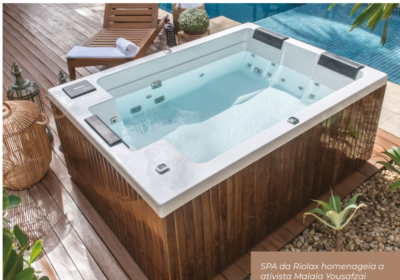
SPA da Riolax homenageia a ativista Malala Yousafzai

Muito além das divas do cinema e da música, a Riolax também homenageia, em seus produtos, mulheres ativistas, como é o caso da paquistanesa Malala Yousafzai. Considerada uma das 100 pessoas mais influentes do mundo por uma famosa revista estadunidense, com apenas 17 anos, ela foi a pessoa mais jovem a receber o Prêmio Nobel da Paz.